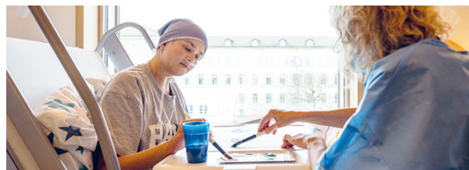
Kunst- und Ausdruckstherapie für kritisch kranke Kinder