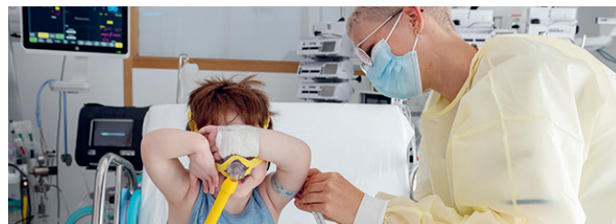
Ernährungsberatung auf der Intensivstation

Die Stiftung Chance für das kritisch kranke Kind engagiert sich dort, wo sonst keine Mittel verfügbar sind. Sie wird ausschliesslich durch Spenden finanziert.