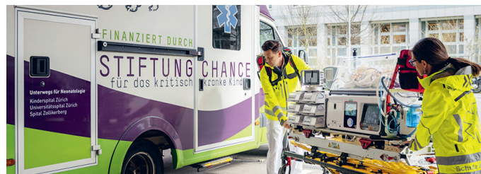
Baby Ambulanz und Inkubator für Transporte kritisch kranker Neugeborener