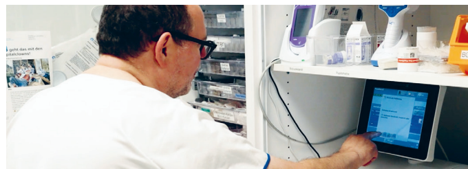
Mitfinanzierung bzw. Anschaffung von Geräten